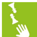
ACTIVITÉS & ANIMATIONS